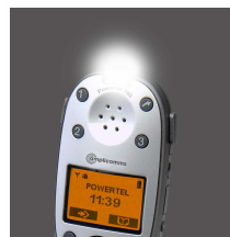
Extra helle Signal-LED's